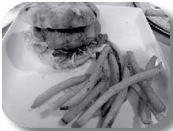
カイテンゲンゲのフィッシュ・バーガー

その上、水分も多くて、料理しにくい です。でも、食べられる物だから、すてるのは もったいないと思います。これまで食べていなかった物を、おいしく食べられるようにしたいです。 これが 料理人としての仕事だと思います。」と話していました。