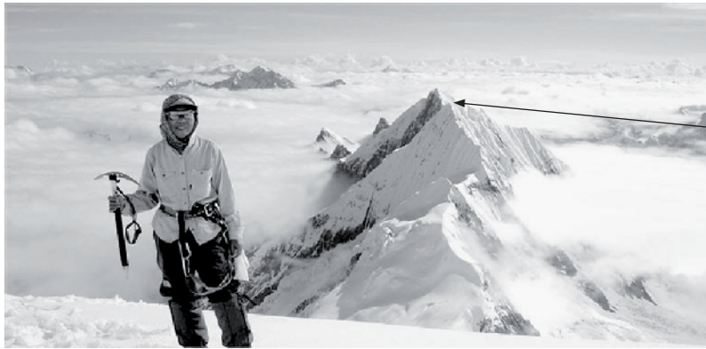
ちょうじょう 頂上